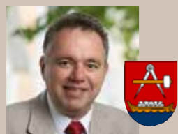
Christian Aufreiter Bürgermeister Langenstein