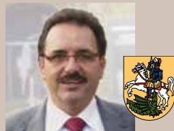
Erich Wahl Bürgermeister St. Georgen/Gusen